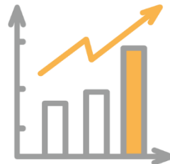
DZIAŁANIA WSPIERAJĄCE ROZWÓJ I FUNKCJONOWANIE ORGANIZACJI