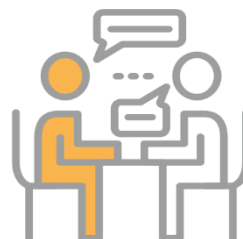
COACHING I KONSULTACJE