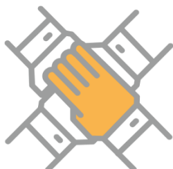
WARSZTATY DLA ZESPOŁÓW