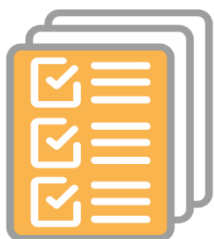
BADANIA, DIAGNOSTYKA, AUDYTY